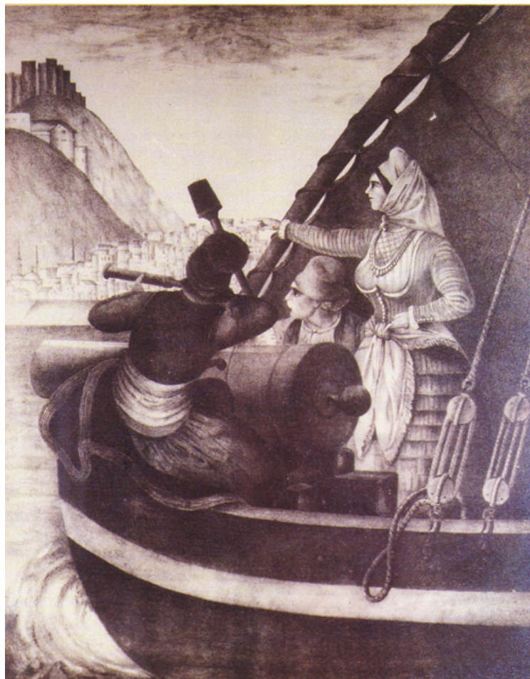
Bouboulina tijdens de slag bij Nafplion

13 maart 1821 werd de eerste revolutionaire vlag gehesen op Spetses door Bouboulina in de grote mast van Agamemnon en ze eert deze met kanonschoten. Op 3 mei komt Spetses, dat naast Hydra en Psara de leidende marinestrijdkracht was in de Griekse Revolutie, in opstand. Bouboulina voert haar eigen en nog andere schepen aan. In totaal acht schepen zeilen naar Nafplion, om dit enorme fort dat bewapend was met 300 kanonnen, van de zee af te sluiten. Het landen van troepen bij het vlakbij gelegen Mili, haar krachtige woorden en grote enthousiasme gaven de