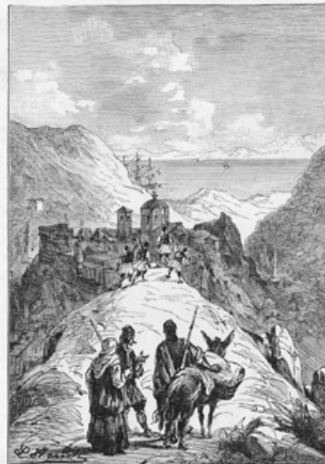
Toes de Syplonta in de omtrekken van Scio ontvaard was. (bladz. 119).