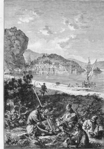
Nauplia. (bladz. 156).