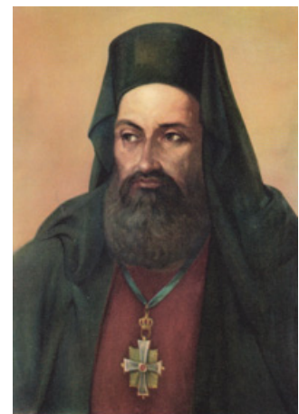
Palaion Patron Germanos