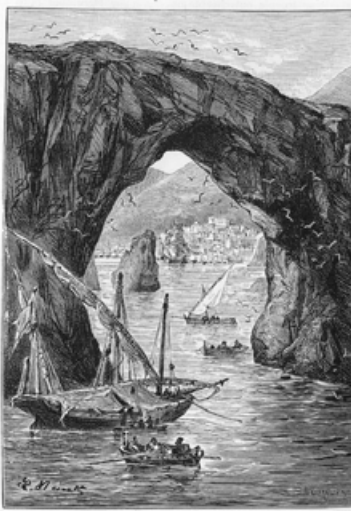
Twee loodrechte rotsen, die als het ware eene poort vormen. (bladz. 63).