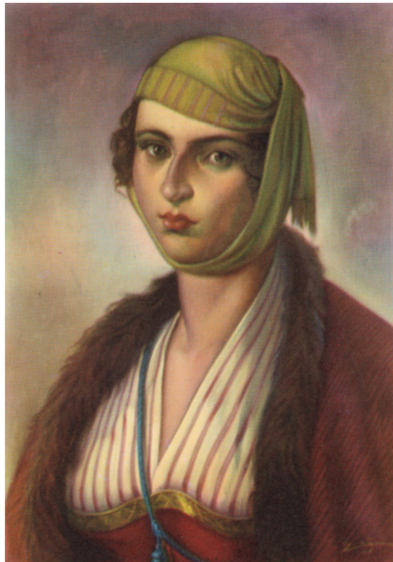
Laskarina Bou Boulina