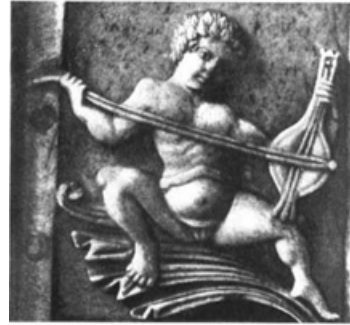
Byzantijns ivoren kistje met afbeelding van een rebab. Ca. 1000.

Tabourka is denk ik een verschrijving van het woord tarbouka. De vaas-vormige trommel werd vroeger van klei gemaakt en tegenwoordig van koper. Ook dit instrument heeft vele namen: darbuka, tarambouka, dümbek, toublerleki, toumberleki. De trommel wordt met twee handen bespeeld. Als de speler zit wordt het instrument meestal op het bovenbeen gelegd.